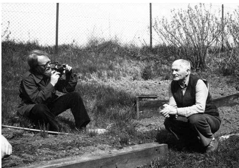
Taras Kuščynskij a Bohumil Hrabal