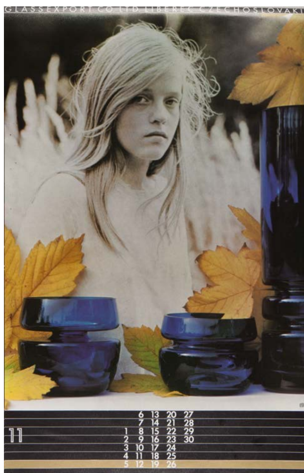
Taras Kuščynskij – kalendář Glassexport 1978 © dědicové

kurátor výstavy: Pavel Vančát produkce: Vladana Rýdlová, Taktum koprodukcce: Petr Mändl, Porte, o. s. grafický design a architektura: Jan Šerých odborná spolupráce: Radka Ciglerová koordinace: Klára Voskovcová, Eva Holečková www.taras.cz www.taktum.cz , www.porteos.cz