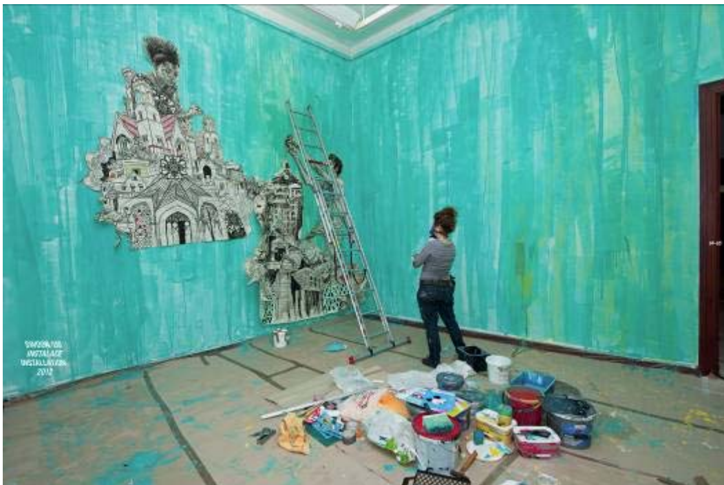
SWOON (US), 2012, Městská knihovna Galerie hlavního města Prahy