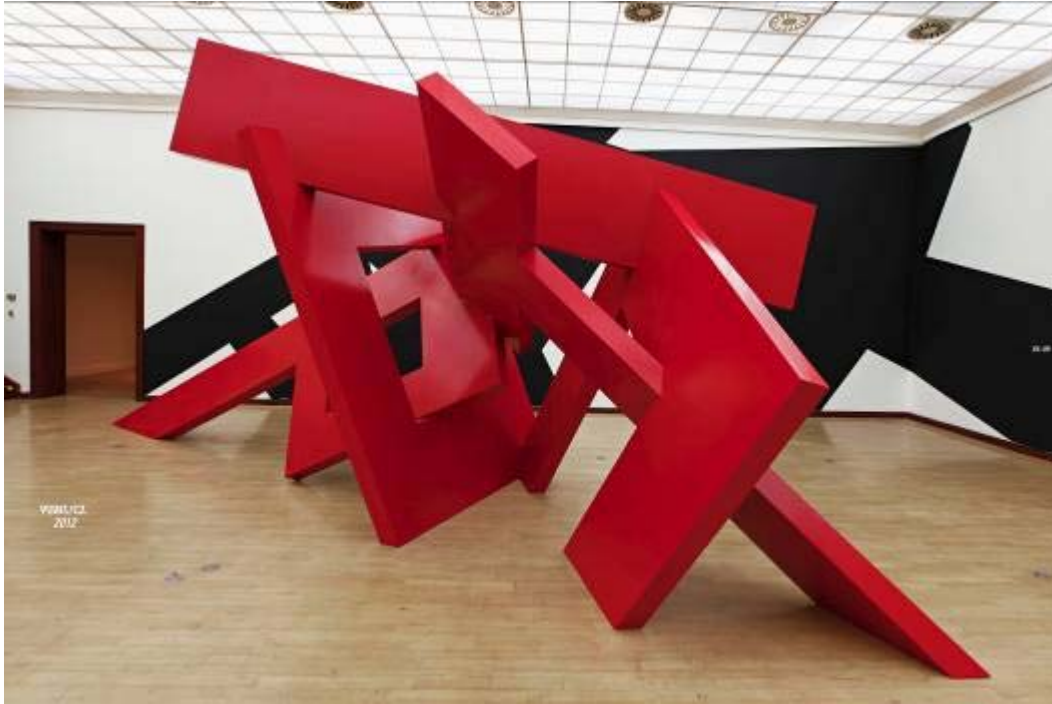
POINT (CZ), 2012, Městská knihovna Galerie hlavního města Prahy